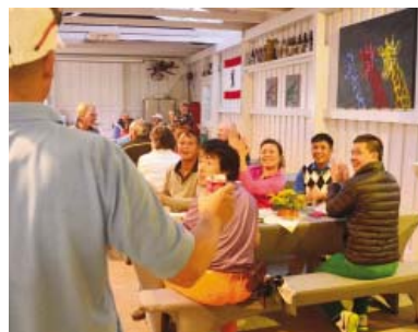
● Feier mit Ausstellung in der Festhalle