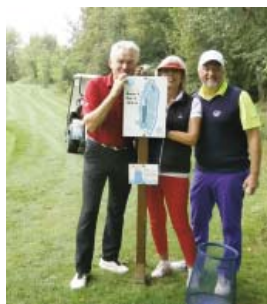
● Am Tee 31 (Bahn 1 des Kurzplatzes)