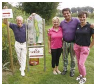
● Tee 26 (Bahn 14, Sepp Maier Platz)