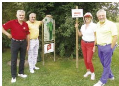
● Am 17. Abschlag (Bahn 1, am Fließ)