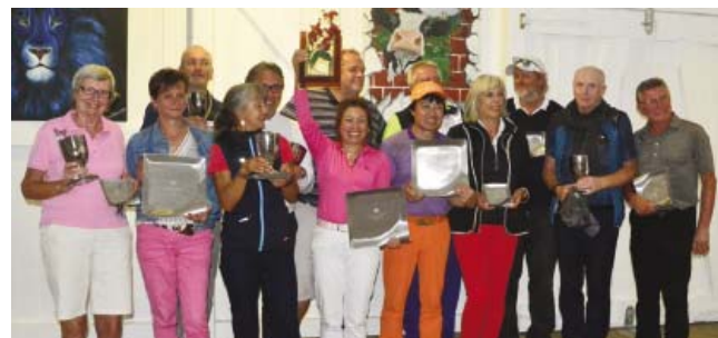
● Die Sieger des 36-Loch-Turniers