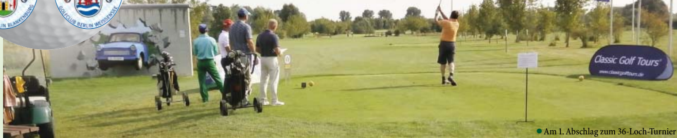
● Am 1. Abschlag zum 36-Loch-Turnier

Traditionell wird am Donnerstag vor dem Sepp Maier Turnier ein Stableford-Turnier über alle 36 Bahnen des Golf Resort Berlin Pankow gespielt: So auch dieses Jahr – Sepp Maier war natürlich dabei.